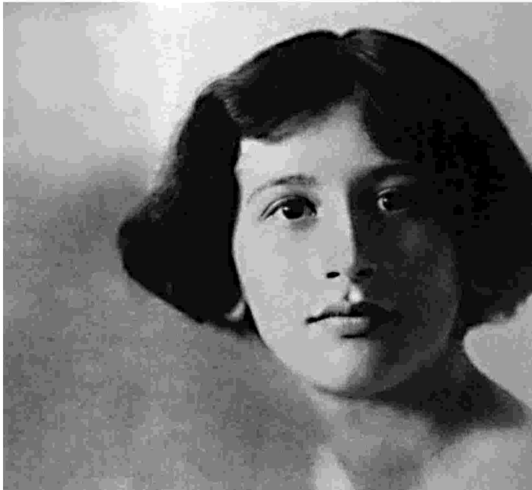
Simone Weil a Marsiglia