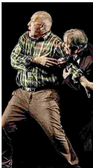
"Dove sono le lucciole"