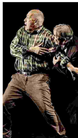
"Dove sono le lucciole"

Prenotazione segreteria@teatroinvito.it dal lunedì al venerdì 9,30-13; info 0341 1582439 346.5781822.